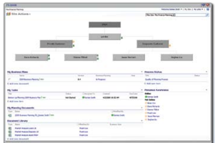
Flexible Methoden zur konsistenten Geschäftsjahresplanung

Mit diesem Serviceangebot professionalisieren wir schnell und preisgünstig Ihr gesamtes MIS-Reporting.